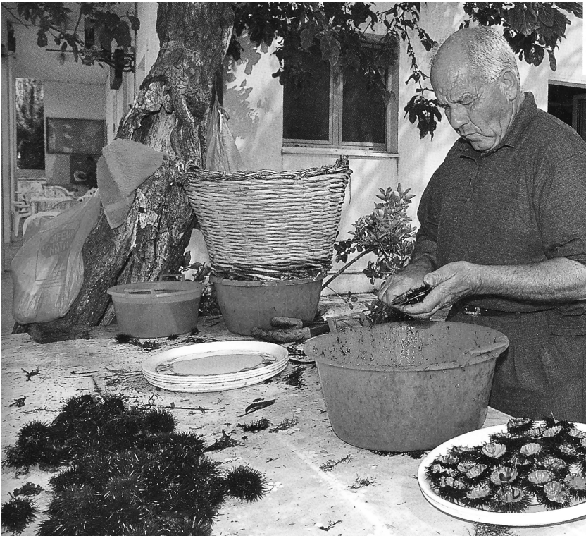
Pulizione di ricci di mare